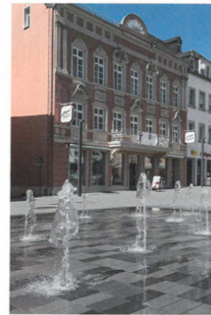
Ein bodenbündiges Wasserfontänenfeld und Lichttechnik bespielen den Stadtplatz akustisch und visuell.

Material-, Farb- und Formatkanon „Bei der Auswahl des gestaltungswirksamen Bodenpflasters hatte eine dem Stadtbild angepasste Material-, Farb- und Formatanwendung oberste Priorität“, beschreibt der Landschaftsarchitekt das Gestaltungsprinzip. Mit der favorisierten Variante des „Stadtparketts“ von Metten